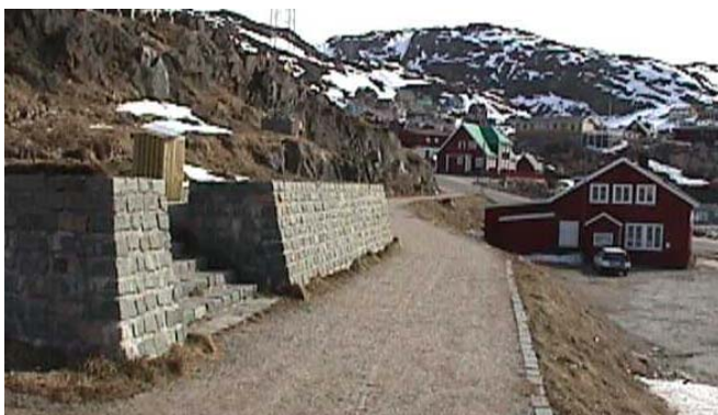
Skrænten og stien ved Torvevej, hvor det er muligt at se skulpturer fra projekt sten og menneske, er en fredfyldt plads i byen.