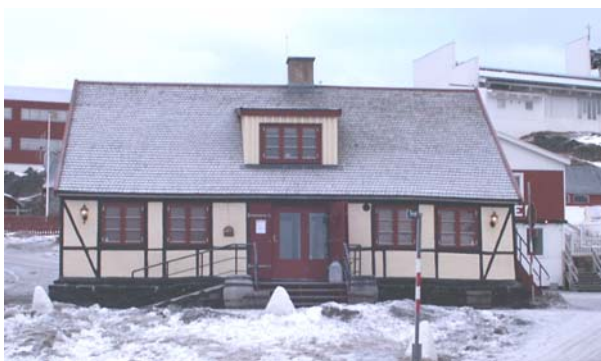
B-67 ved torvet, er et eksempel på hvor smuk en bygning kan blive, når ændringer foretages under hensyntagen til bygningens oprindelige arkitektur.