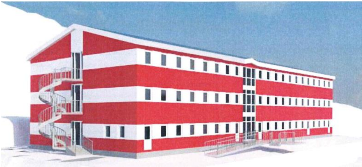
Facadeillustration fra projektforslaget

Placeringsmulighed som kan rummes inden for dette kommuneplantillæg.