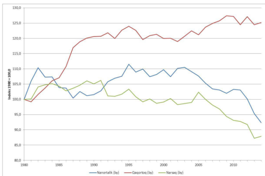
Figur 5. Befolkningsudviklingen i tre byer, indeks 1980=100,0