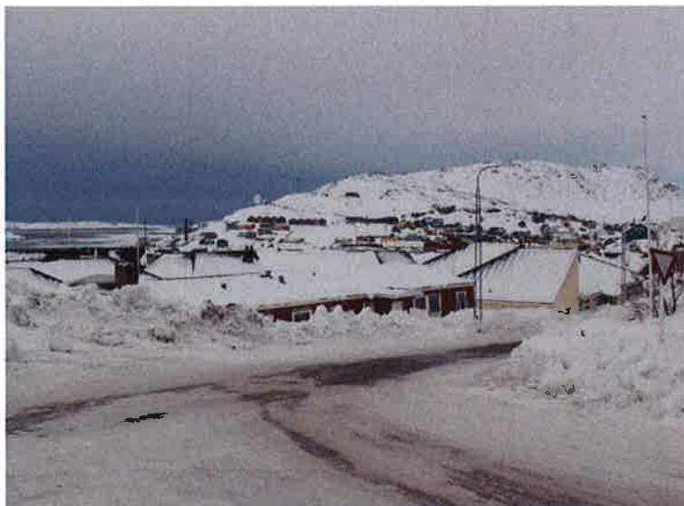
Byggegrunden set fra hjørnet af Peter Høeghs vej og Ringvej

Visualisering af udvidelsen af alderdomshjemmet, efter denne revision af kommuneplanen: