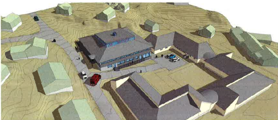
Visualisering af tilbygning til alderdomshjemmet set i fugleperspektiv.