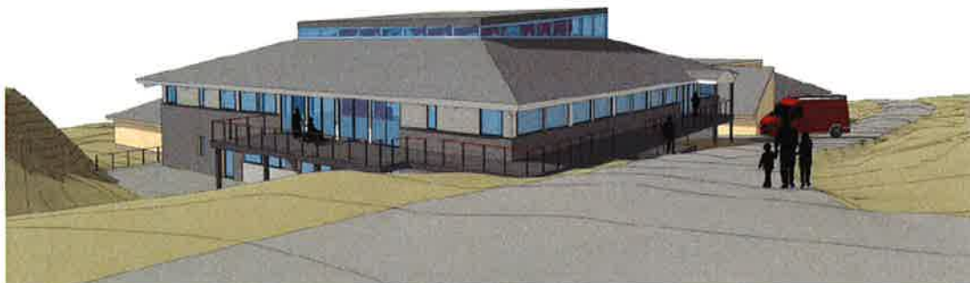
Visualisering af alderdomshjemmet set fra Peter Høegs vej og Ringvej.

Visualisering af udvidelsen af alderdomshjemmet, efter denne revision af kommuneplanen: